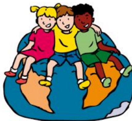
We horen bij elkaar

Om de sfeer direct goed neer te zetten hebben de kinderen de eerste twee weken iedere dag een Vreedzame Schoolles. Bij de andere blokken hebben de kinderen iedere week één les.